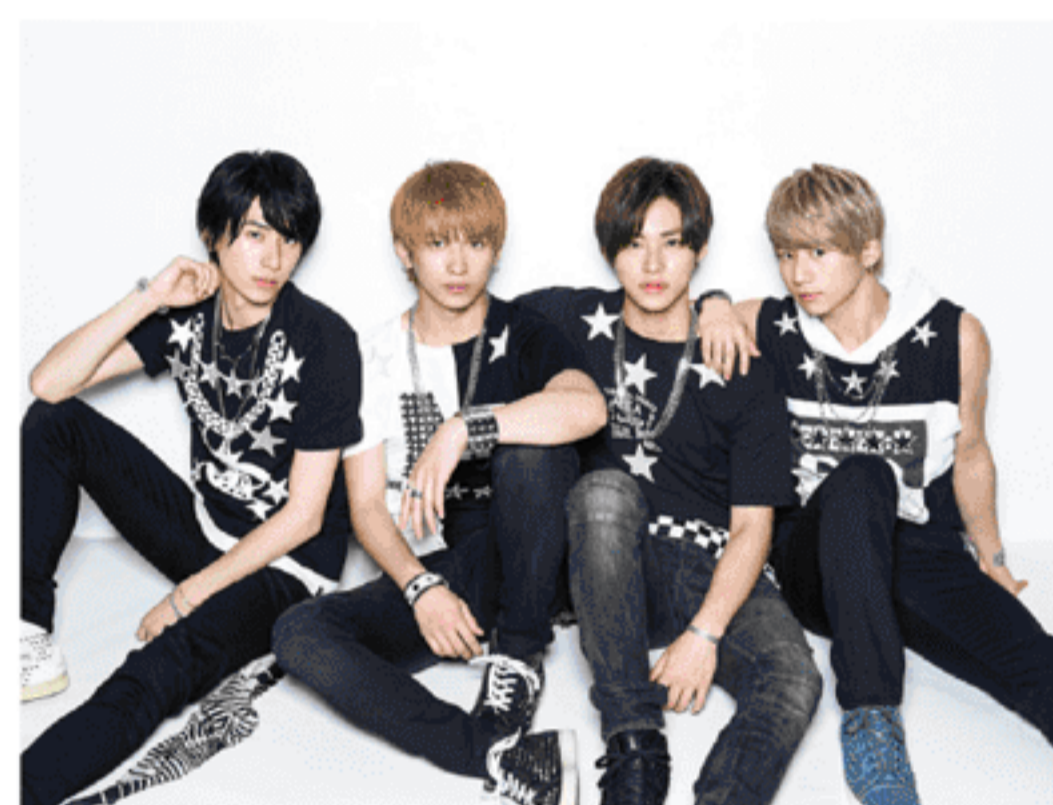
九星隊(ナインスターズ)